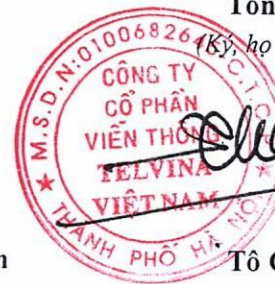
Tô Chí Thành