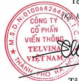
Tô Chí Thành