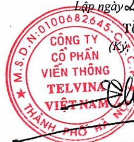
Tô Chí Thành