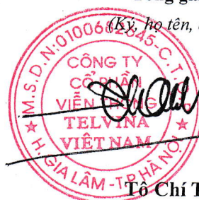
Tô Chí Thành