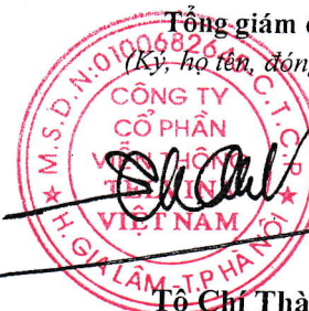
Tô Chí Thành