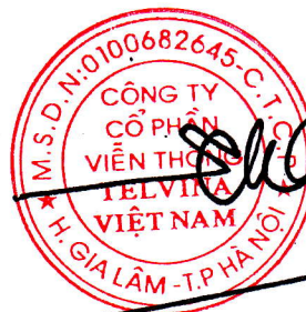
Tô Chí Thành