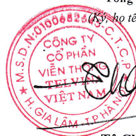
Tô Chí Thành