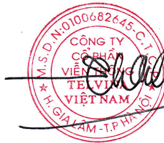
Tô Chí Thành