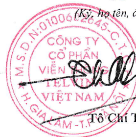
Tô Chí Thành