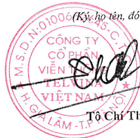
Tô Chí Thành