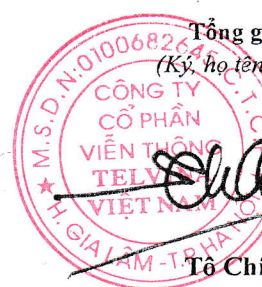
Tô Chí Thành