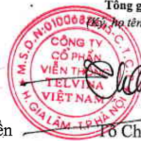
Phó Chí Thành